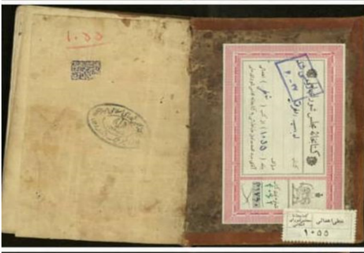
Şekil 2: Âdabu't-Tarik'in Kayıt Varakı